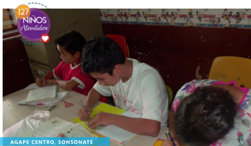
AGAPE CENTRO, SONSONATE