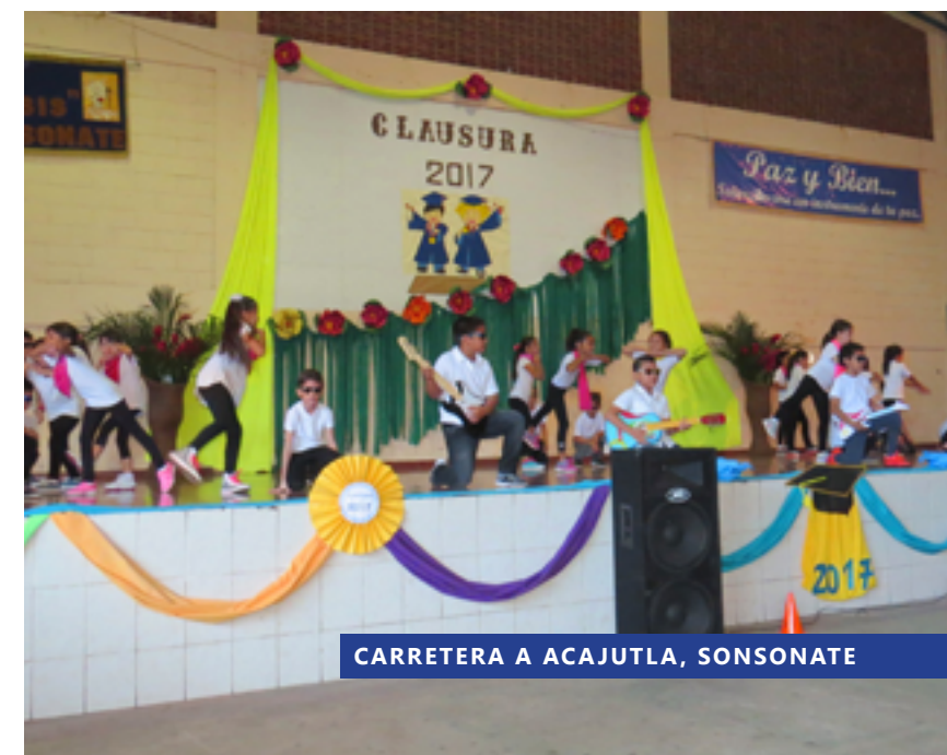
CARRETERA A ACAJUTLA, SONSONATE

Somos una institución educativa que forma estudiantes con base en un proceso planificado que integra aspectos intelectuales, espirituales, deportivos y culturales, fortalecidos con el uso de pedagogía y tecnología moderna. Conjugamos el sentir y el vivir franciscano, la capacidad científica y el liderazgo social. Atendemos 984 estudiantes desde kínder 3 años hasta bachillerato. Desarrollamos en nuestros estudiantes altos estándares de calidad intelectual, valores, con mucha sensibilidad humana y habilidades y destrezas que le permiten continuar exitosamente estudios en niveles superiores y así integrarse al aparato productivo de nuestro país.