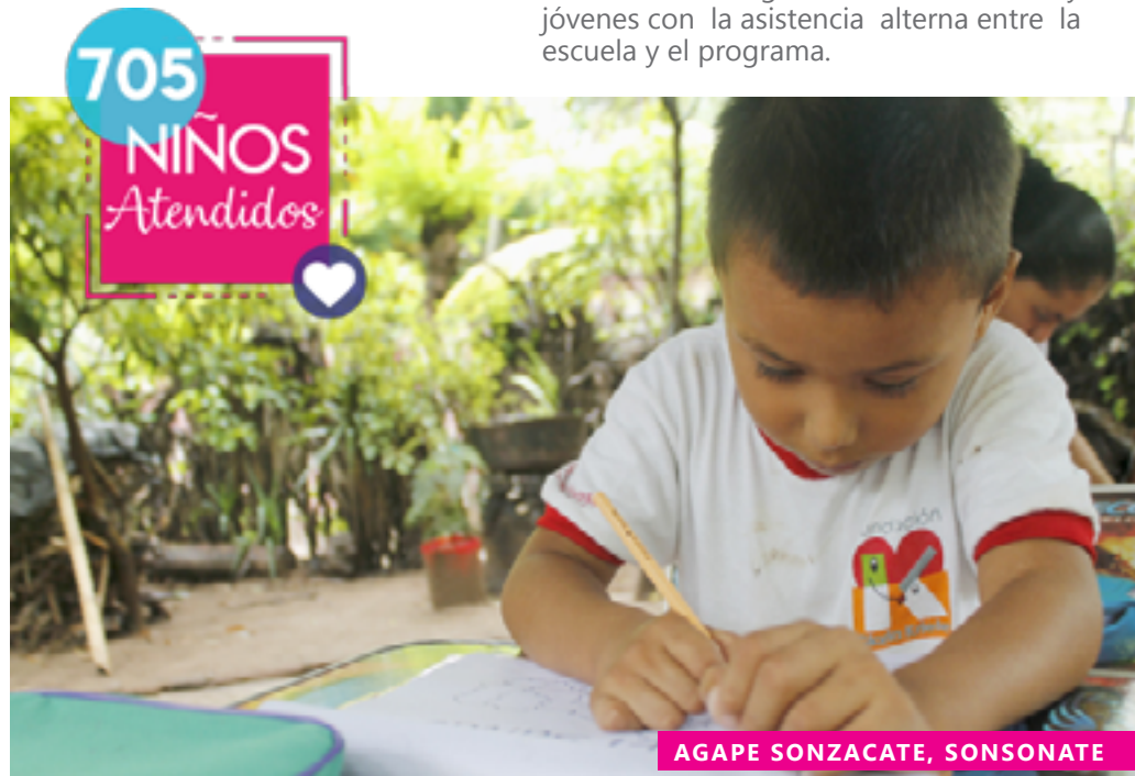
AGAPE SONZACATE, SONSONATE

Este año, 705 niños de comunidades rurales de la zona occidental de nuestro país forman parte del programa preventivo para la primera infancia.