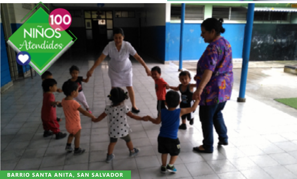
BARRIO SANTA ANITA, SAN SALVADOR