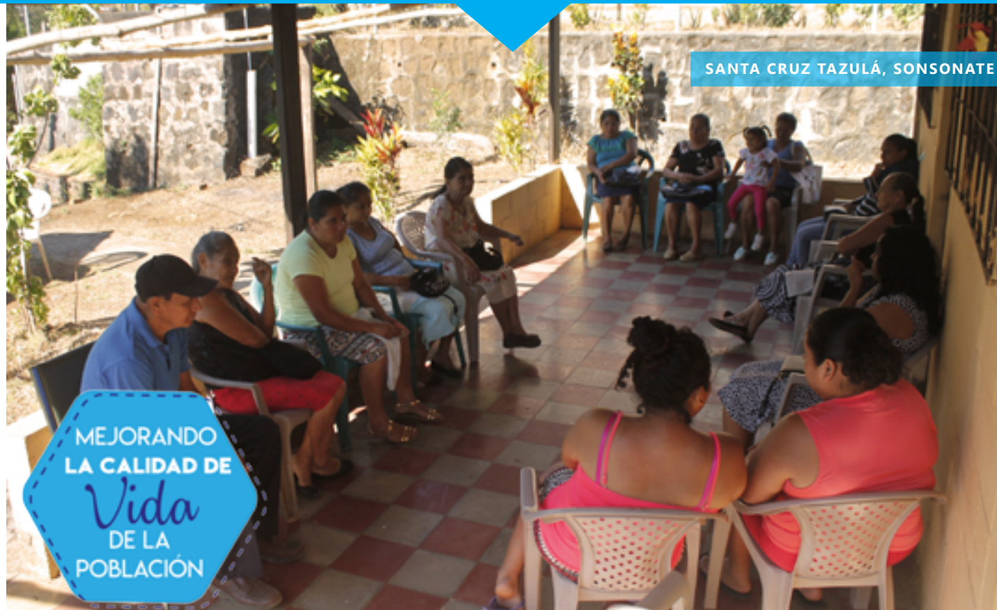
SANTA CRUZ TAZULÁ, SONSONATE

MEJORANDO LA CALIDAD DE Vida DE LA POBLACIÓN